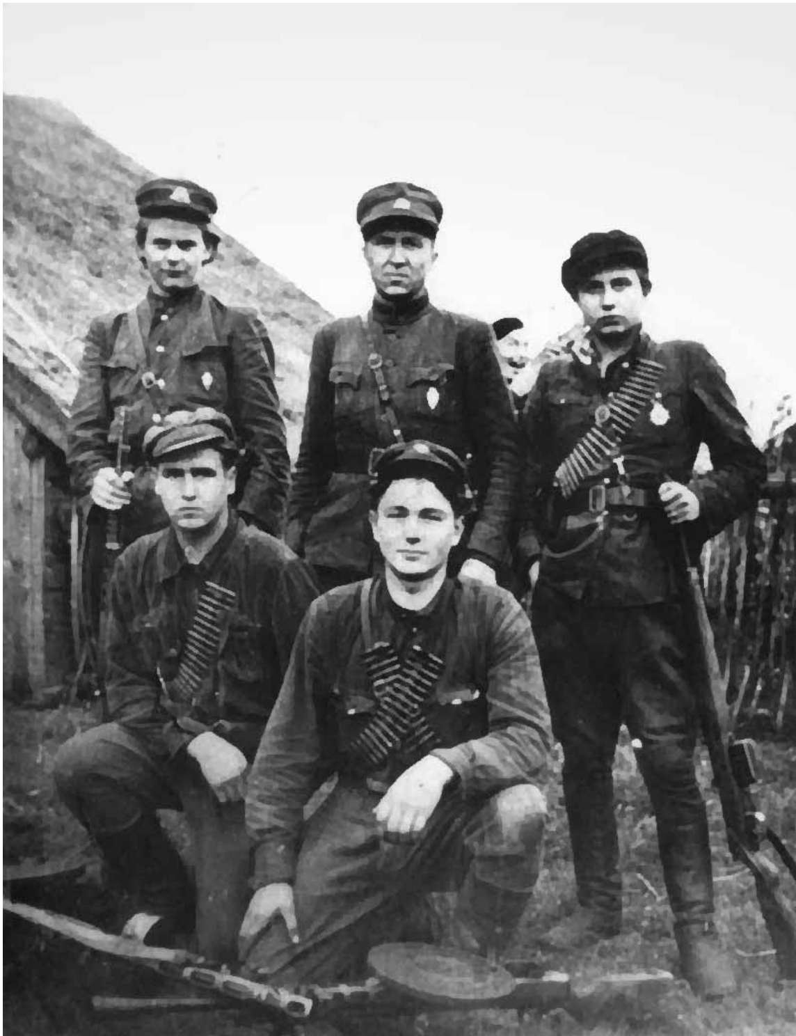
Литовские «лесные братья»