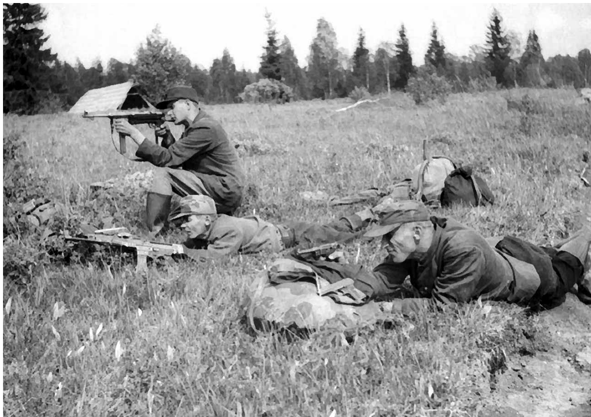
Эстонские «лесные братья»

вания с целью навязать вооруженное столкновение или поднять вооруженное восстание; большим количеством находящихся на нелегальном положении участников карательных батальонов и легионов СС, служащих полиции, жандармерии, людей, служивших в составе немецко-фашистских войск и других карательных органах; сильным влиянием на население региона представителей церкви, откровенно призывающих к непримиримой борьбе с советской властью, активно использующих при этом догмы националистического характера; преобладание у местного населения воззрений националистического характера вследствие некоторых особенностей исторического развития республик Северного Кавказа, Прибалтики, западных областей Украины и Белоруссии и других регионов. Эти факторы обусловили некоторые успехи руководителей повстанческого движения по созданию вооруженных формирований и их деятельности.