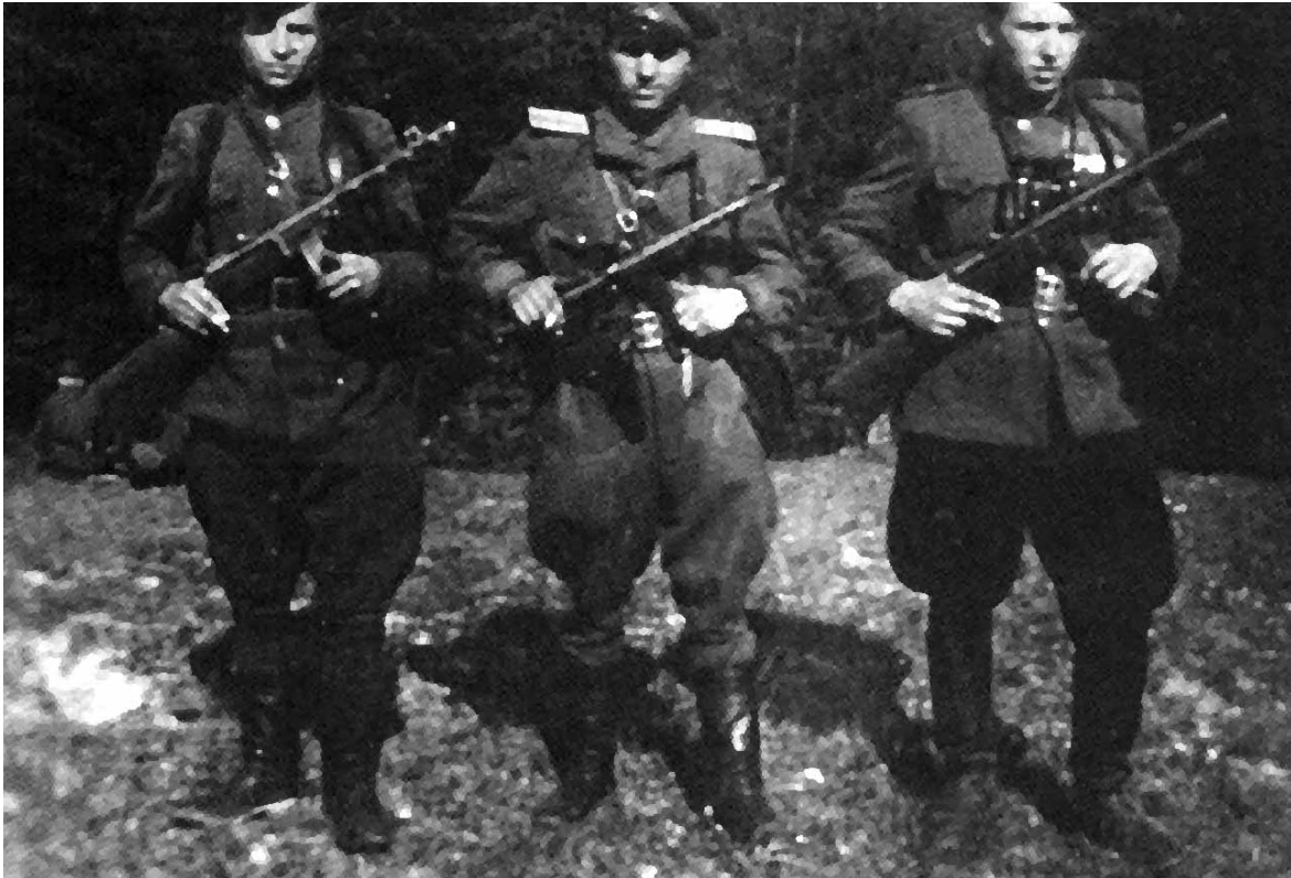
Боевики УПА в форме Красной армии

формирования. Самой разветвленной польской подпольной организацией являлась Армия Крайова (АК). Во главе организации стоял главный комендант АК, которому подчинялись военные округа. Для обеспечения управления в главной комендатуре были организованы отдел главного коменданта АК, занимавшийся разведывательной и контрразведывательной деятельностью, организационный отдел, в ведении которого находились вопросы общего характера. Военный округ объединял от двух до пяти инспекторатов. Инспекторат, или подокруг, организовывал и контролировал через штаб подрывную деятельность на территории 3–6 уездов. Штабу подчинялись 3–4 обвода. Инспектораты именовались «Север», «Юг», «Восток», «Запад» или носили названия основного города в районе, где он действовал.