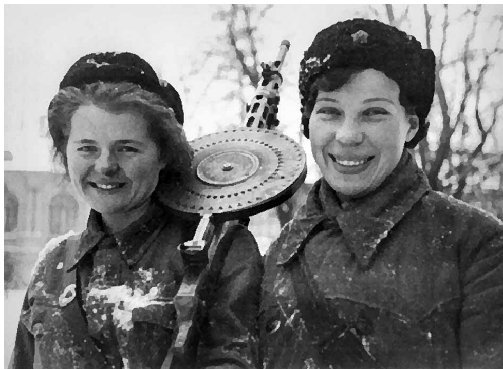
Девушки-пулеметчицы из истребительного батальона