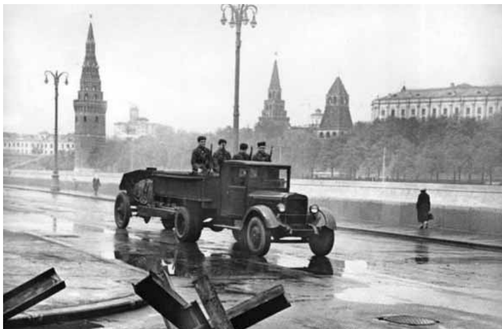
Бойцы истребительного батальона направляются на задание. 1941 г.