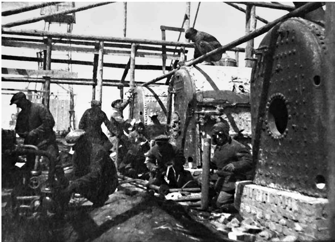
Разборка оборудования завода для последующей эвакуации в тыл