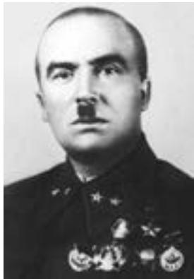
И. И. Федюнинский