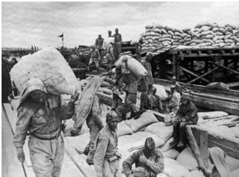
Разгрузка баржи с мукой в ладожском порту Осиновец