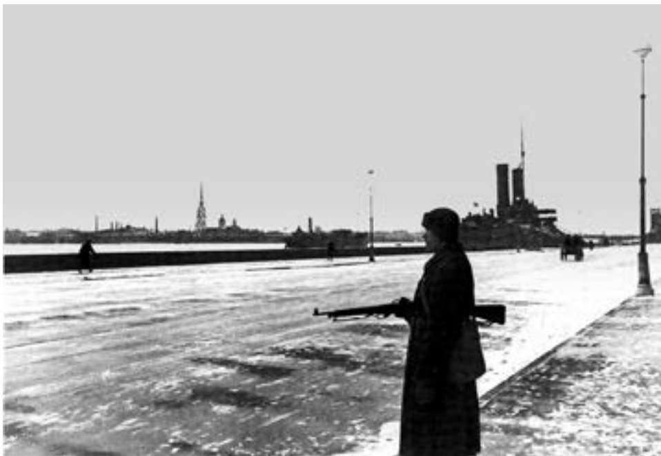
Часовой на набережной 9-го января