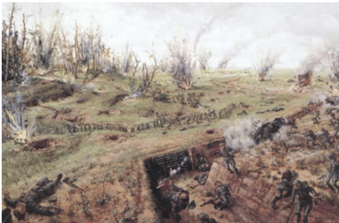
Картина В. Е. Памфилова «Бой на оборонительном рубеже», 1943 г.