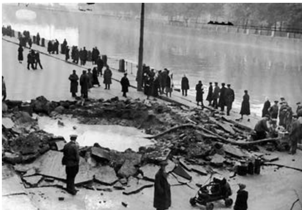
Воронка от авиабомбы на набережной Фонтанки