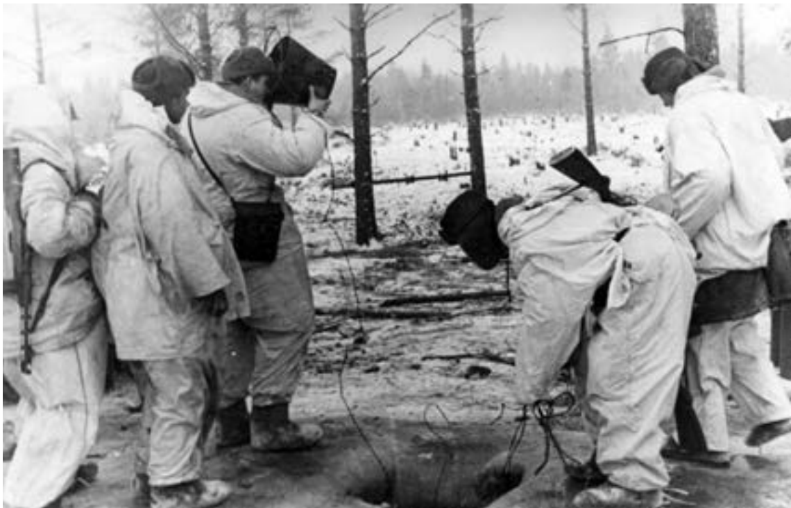
Операция «Искра». Группа бойцов достает воду из реки