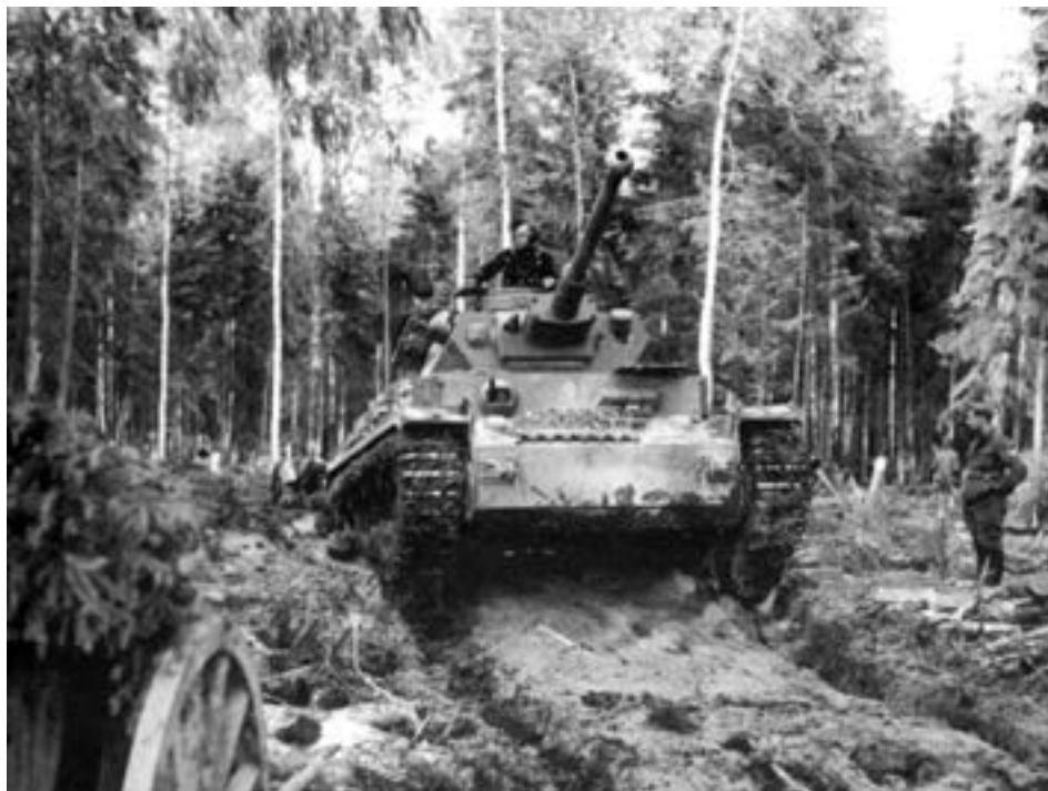
Немецкий танк с трудом двигается по размокшей и вязкой земле в районе Волхова