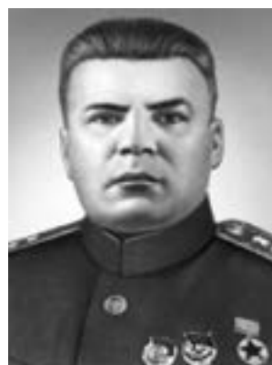
Р. Я. Малиновский