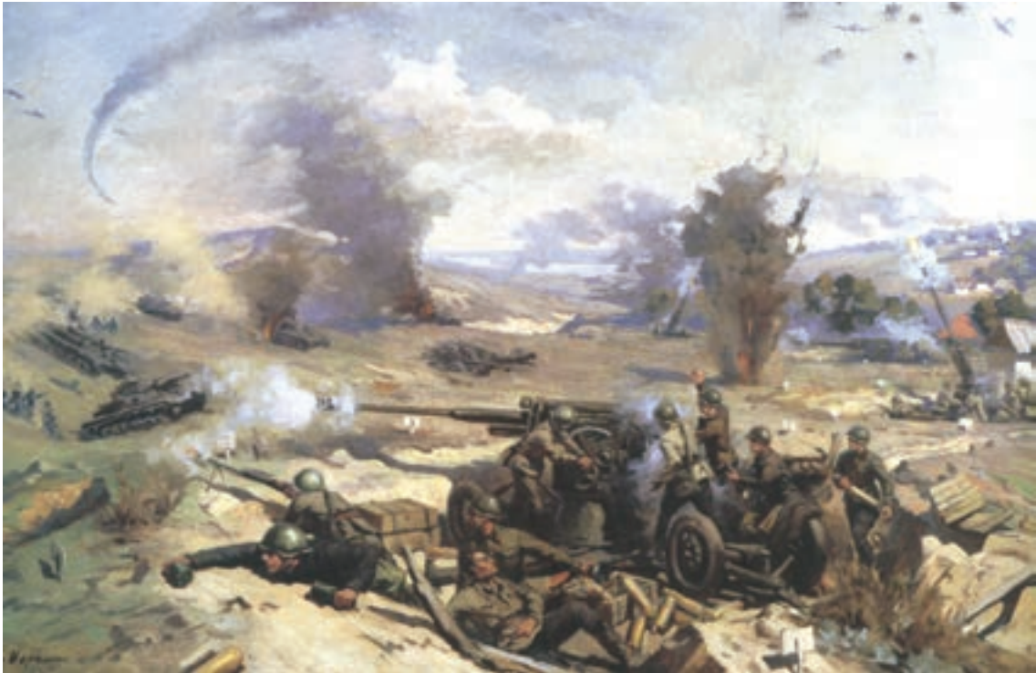
Картина Г. И. Марченко «Зенитная артиллерия в обороне Сталинграда». 1947 г.