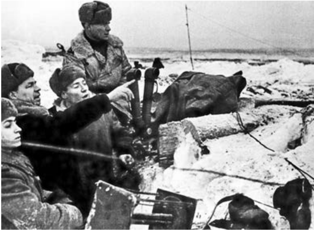
Командир 136-й стрелковой дивизии генерал Н. П. Симоняк на наблюдательном пункте