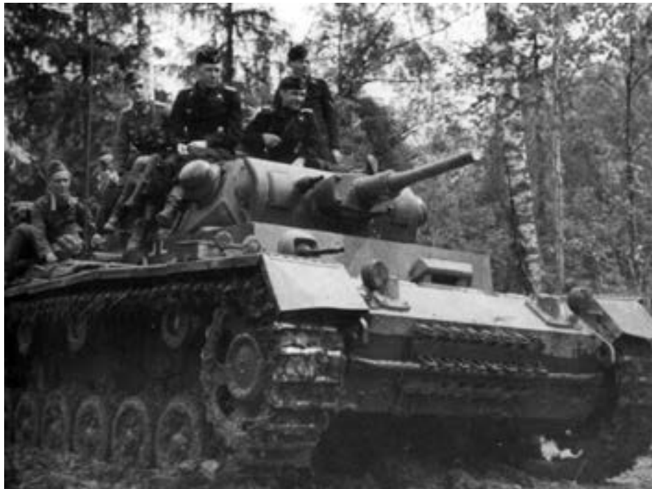
Немецкий танк с десантом на борту