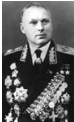
К. К. Рокоссовский