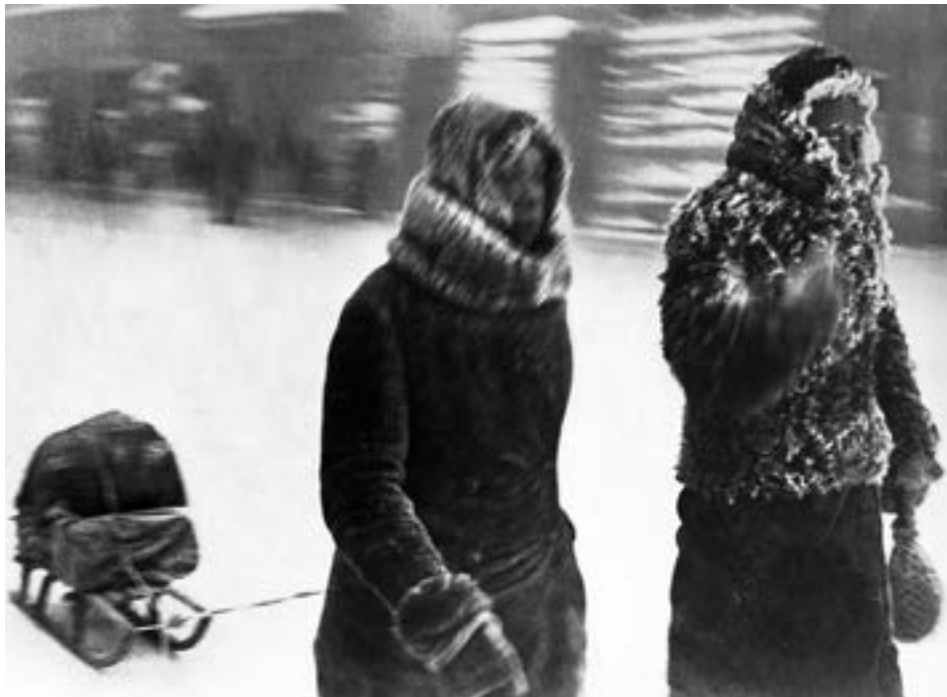
Ленинградцы на Загородном проспекте во время мороза