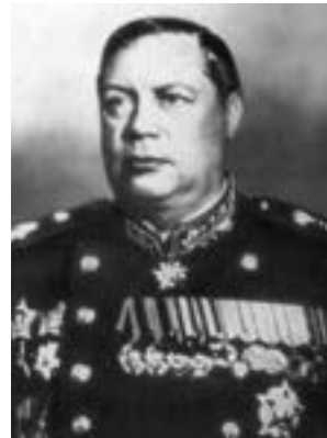
Ф. И. Толбухин