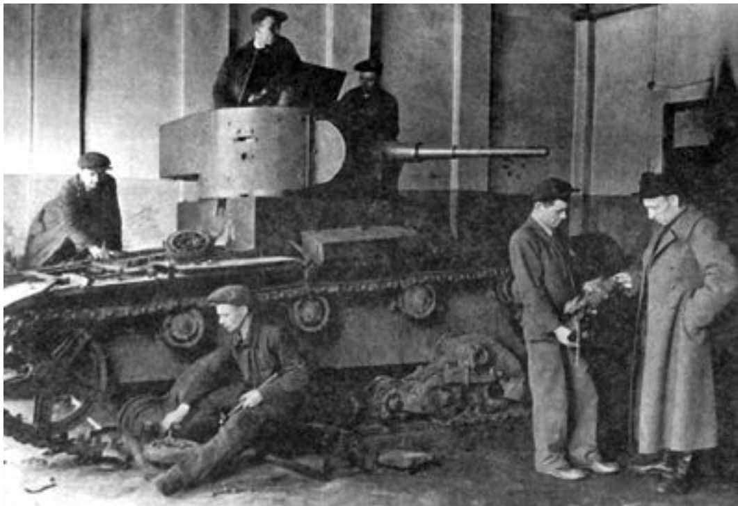
Советский танк Т-26 в ремонтном цеху ленинградского завода