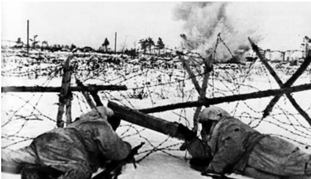
Разведчики Ленинградского фронта у проволочных заграждений