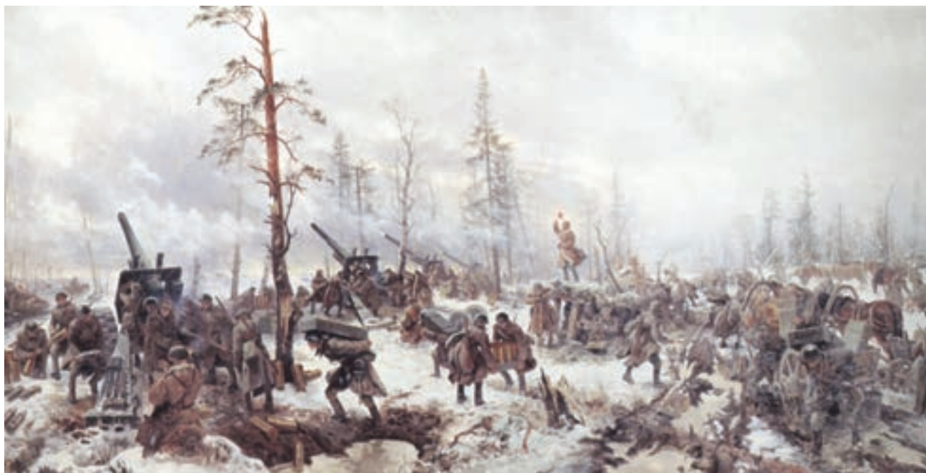
Картина В. Е. Памфилова «Артиллерия под Демянском. 1943 г.», 1944 г.