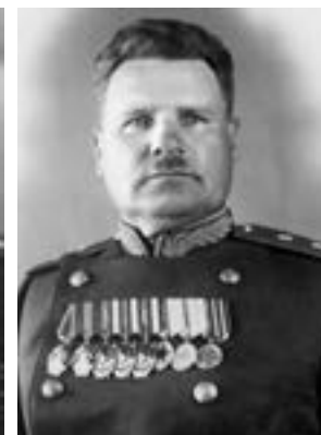
Ф. Н. Ремезов