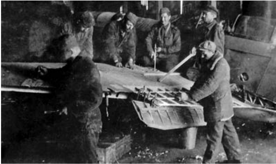
Ремонт крыла советского самолета-истребителя в авиамастерских Ленинграда