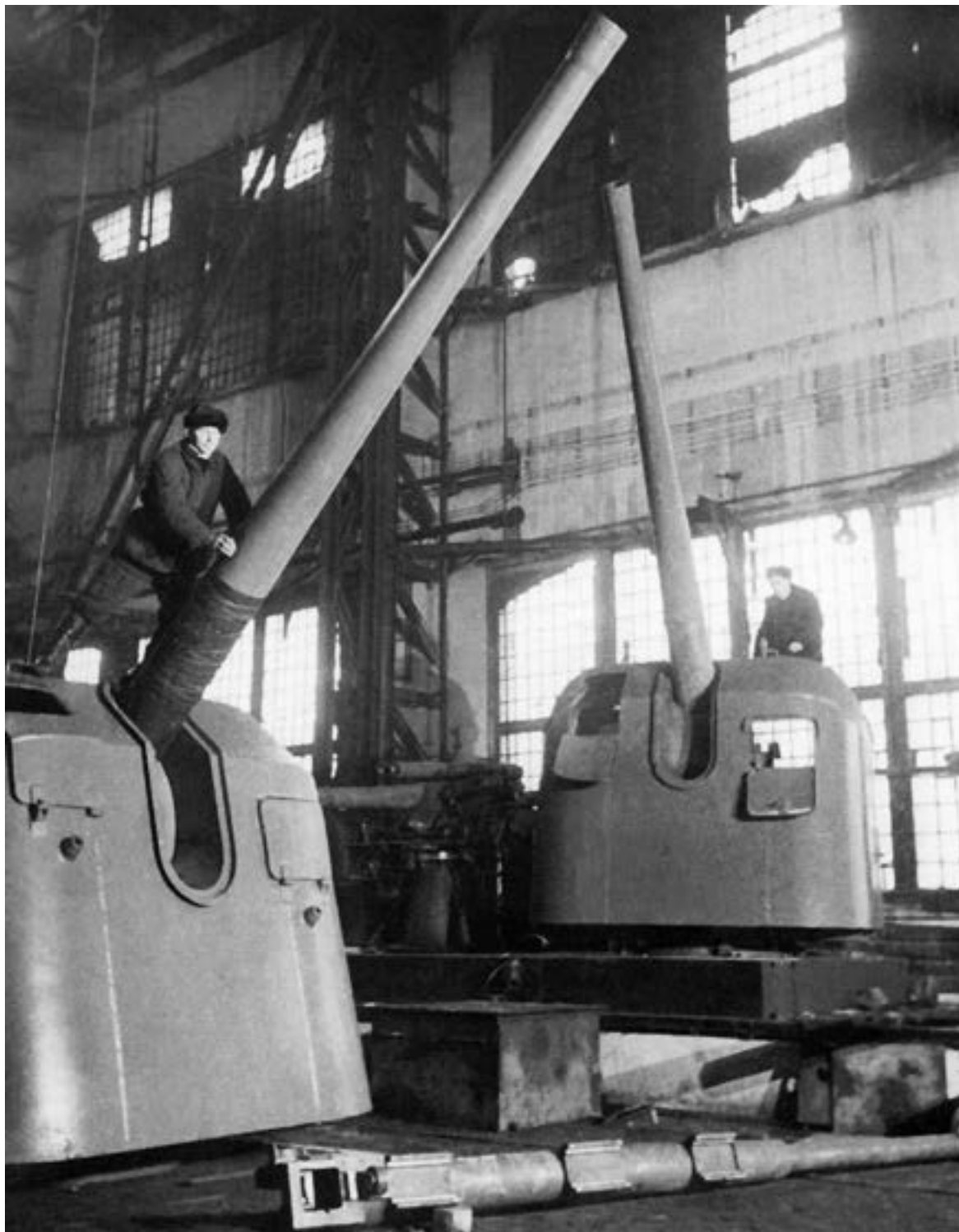
Ремонт корабельных орудий в цехе завода «Большевик»