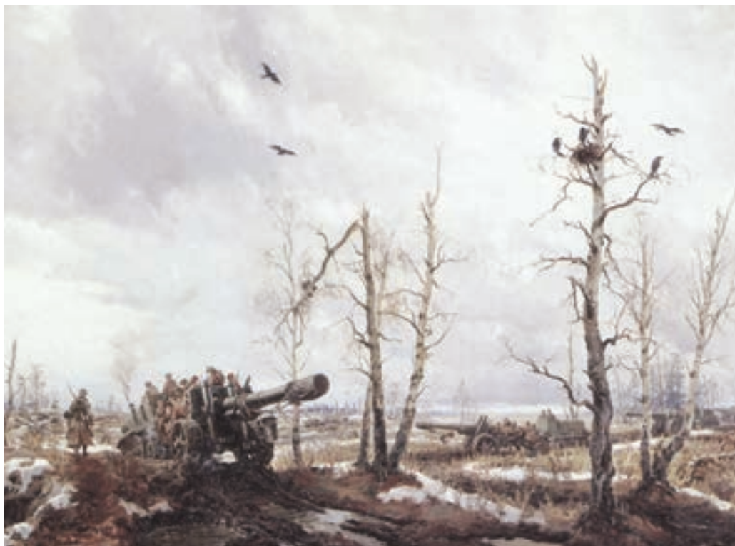
Картина В. Е. Памфилова «Освобожденная земля Смоленщины». 1943 г.