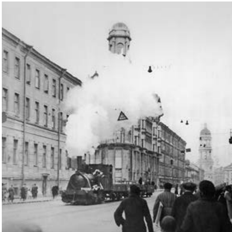
Паровоз, передвигающийся по трамвайным рельсам, на Загородном проспекте в блокадном Ленинграде