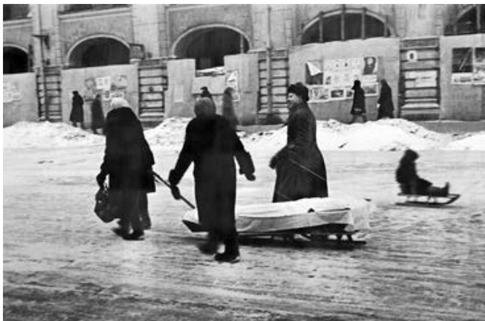
Родственники везут на кладбище умершего блокадника