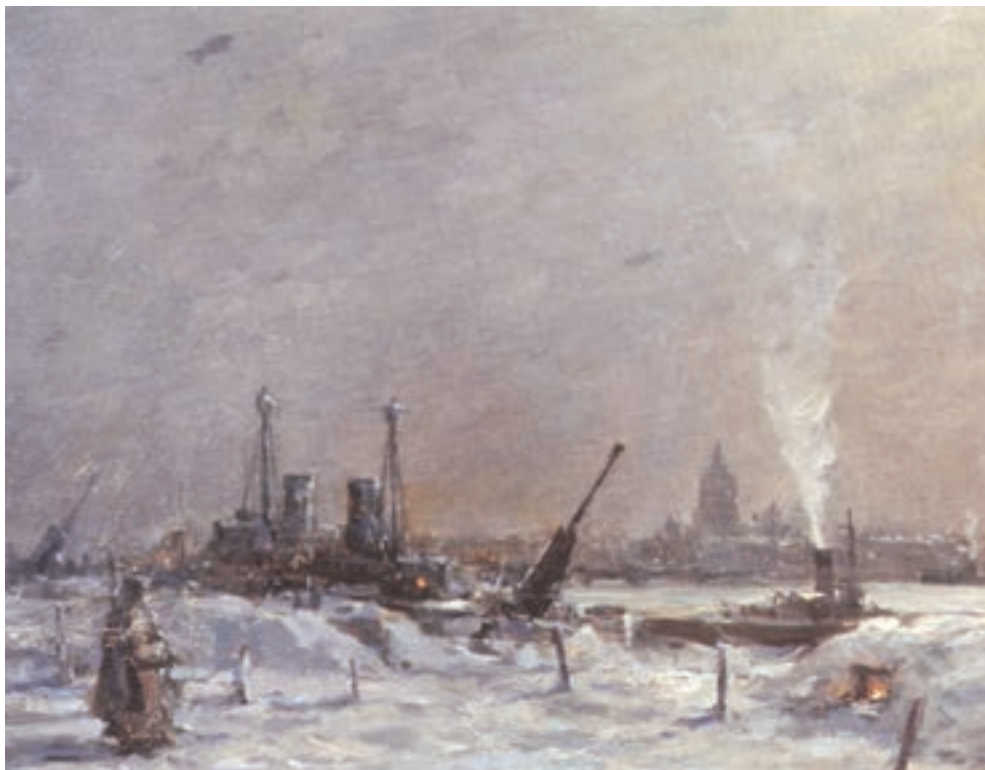
Картина Г. П. Татарникова «Ленинград в блокадную зиму». 1942 г.