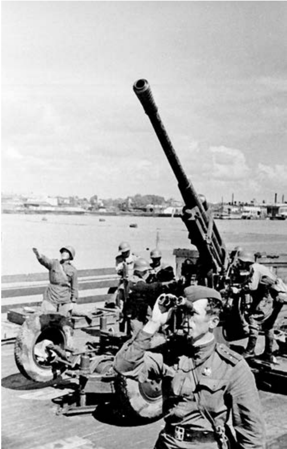
Расчет зенитного орудия на набережной Ленинграда