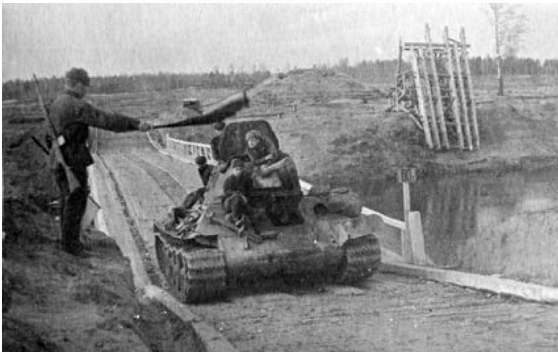
Танк Т-34 преодолевает водную преграду по мосту