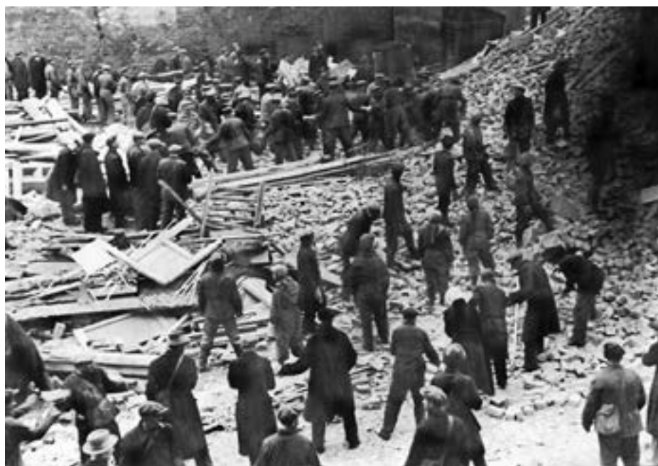
Бойцы восстановительной команды после бомбежки разбирают развалины ленинградского дома