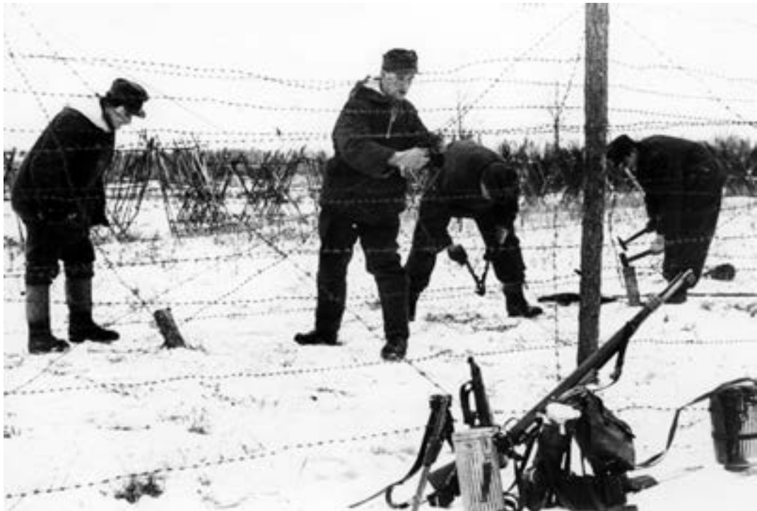
Саперы противника оборудуют противопехотные заграждения из колючей проволоки