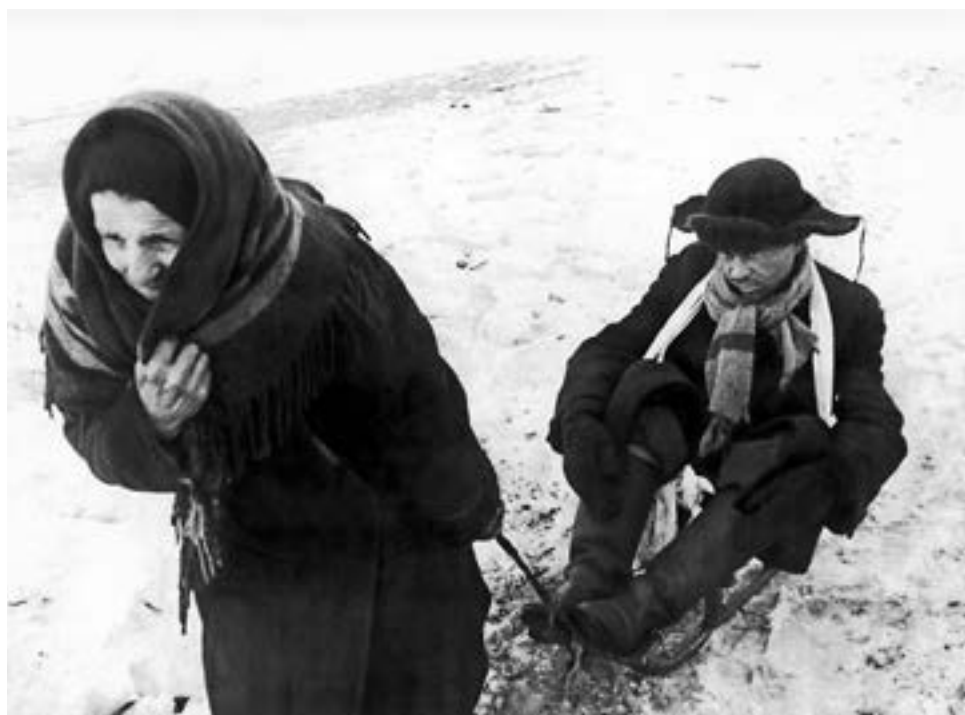
Полное истощение людей не сломило их