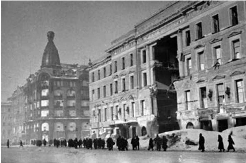
Невский проспект зимой в блокадном Ленинграде