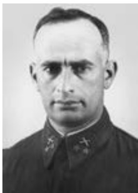
К. Н. Леселидзе