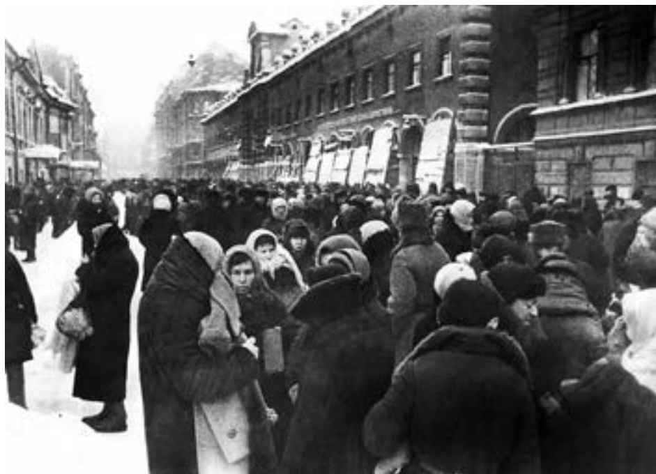
Толкучка у Кузнечного рынка в блокадном Ленинграде