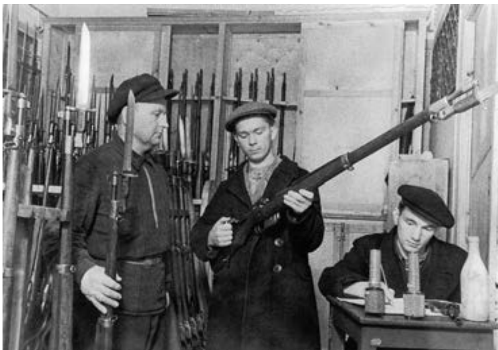
Ленинградские ополченцы получают оружие