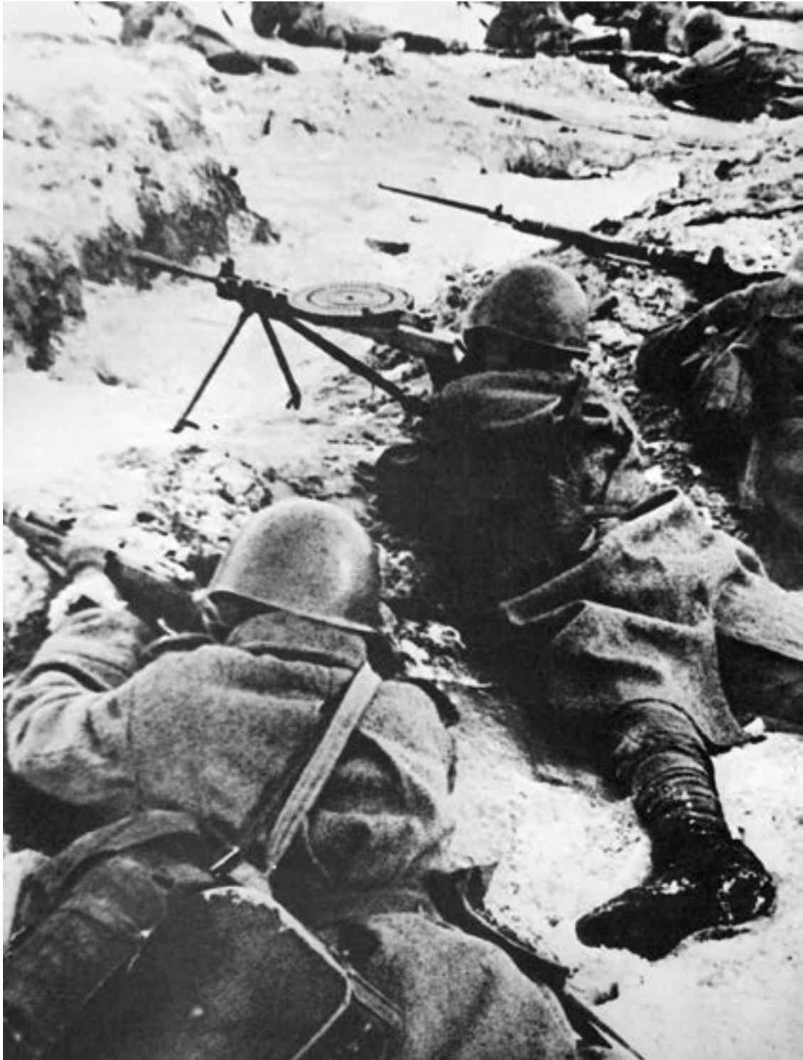
Стрелковое подразделение ведет бой