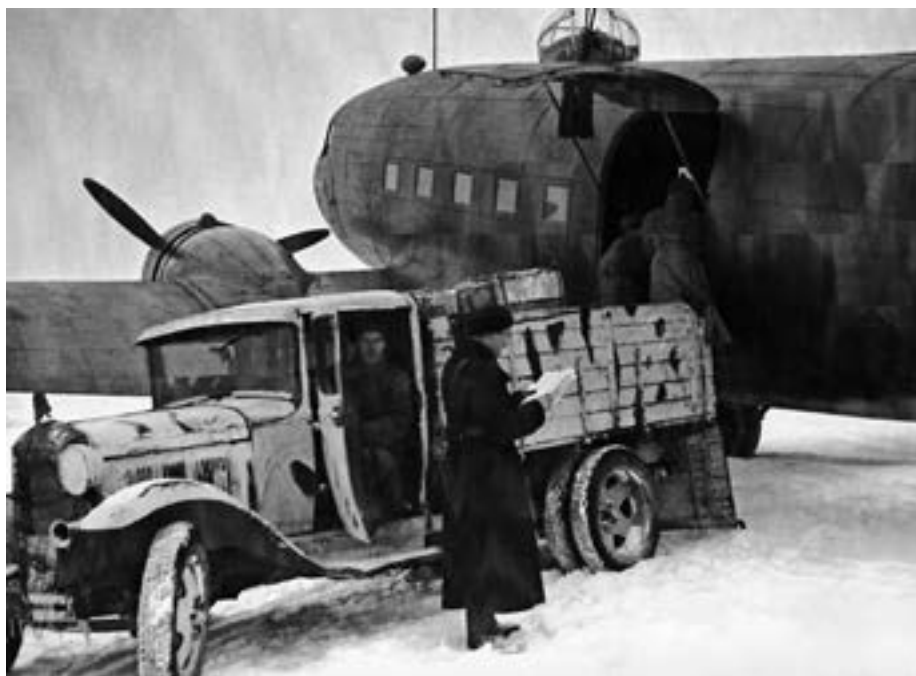
Выгрузка продовольствия для блокадного Ленинграда из транспортного самолета Ли-2