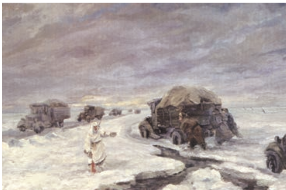
Картина неизвестного художника «Ладожская ледовая трасса». 1945 г.