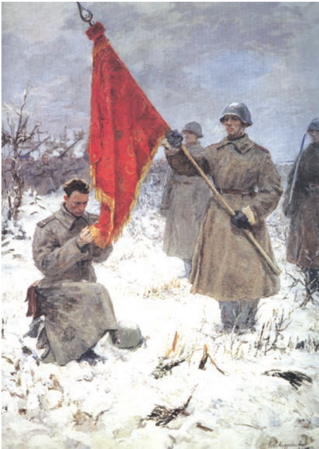
Картина И. И. Кудрявцева «Клятва гвардейцев перед знаменем». 1947 г.