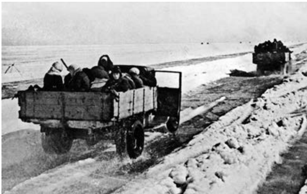
Грузовые автомобили вывозят людей из Ленинграда. Дорога жизни