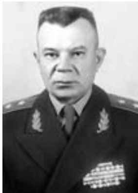
В. С. Поленов