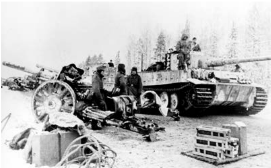
Переброска немецких танков на новый рубеж