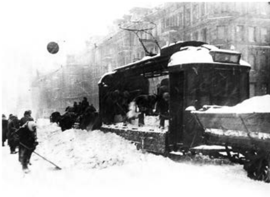
Погрузка сколотого льда и снега в грузовой трамвай на проспекте 25-го октября