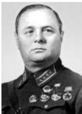
К. А. Мерецков