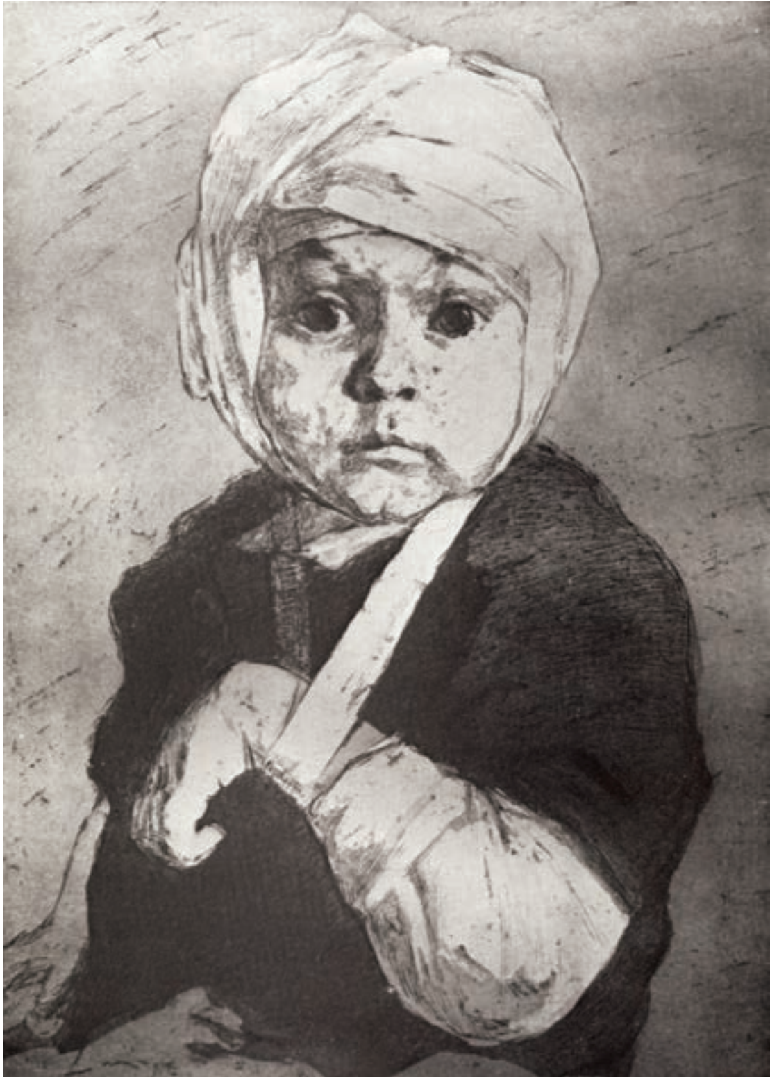
Картина А. И. Харшака «За что?». 1943 г.