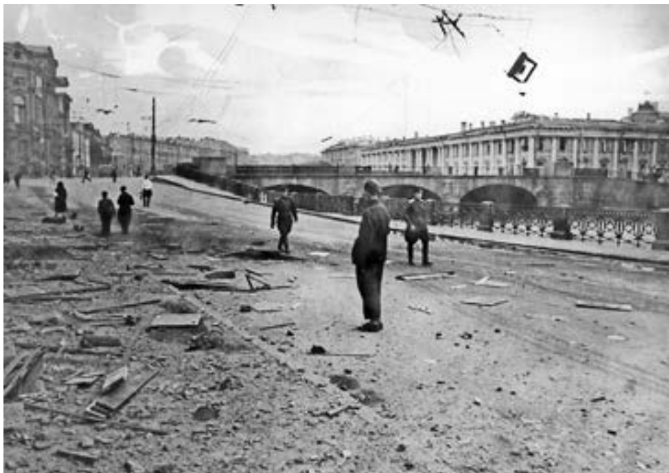
Набережная реки Фонтанки в Ленинграде после немецкого артобстрела