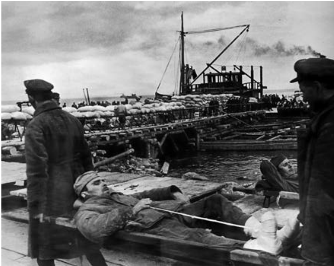
Эвакуация раненых в ладожском порту

Новая Ладога по плану перевозок являлась пунктом формирования конвоев, прибывавших с грузами из Гостинополья и Сясьстроя. Отсюда должны были идти на Ленинград продовольственные грузы и военно-техническое имущество, а сюда поступать эвакуируемое из Ленинграда гражданское население. Причальный фронт в Новой Ладоге развития не получил, были лишь отремонтированы имевшиеся причалы.