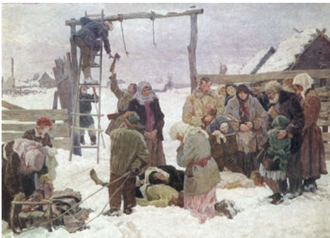
Картина Т. Г. Гапоненко «После изгнания фашистских оккупантов». 1943–1946 гг.