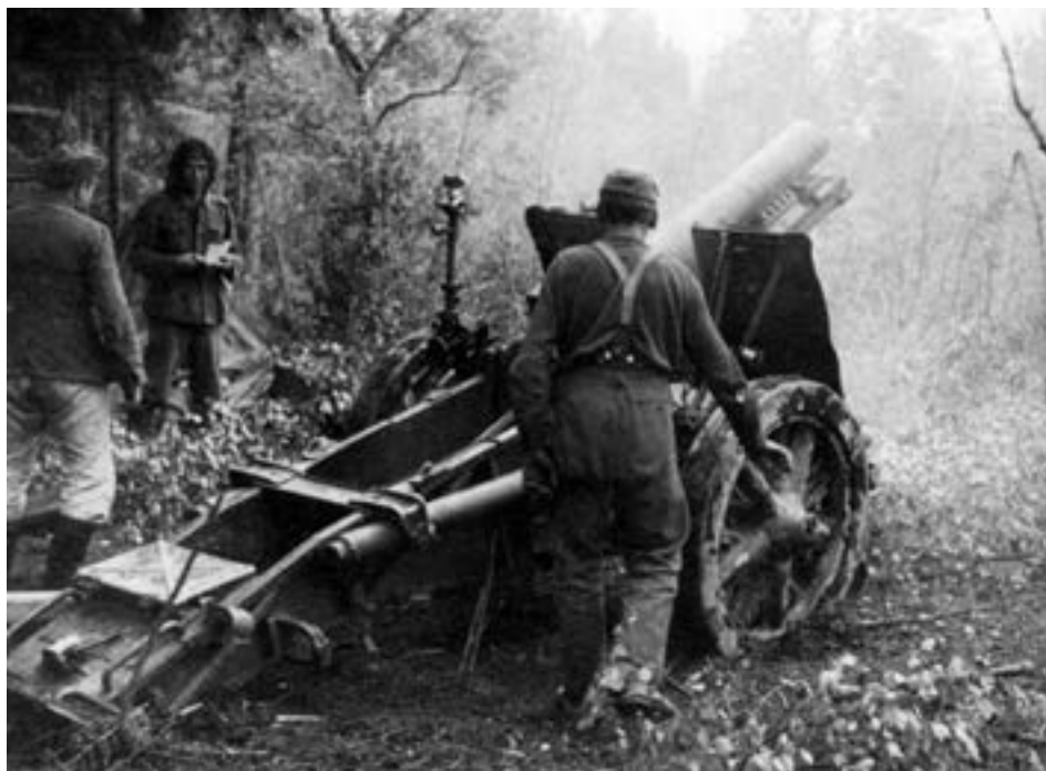
150-мм немецкая гаубица ведет огонь по позициям советских войск в районе Волхова