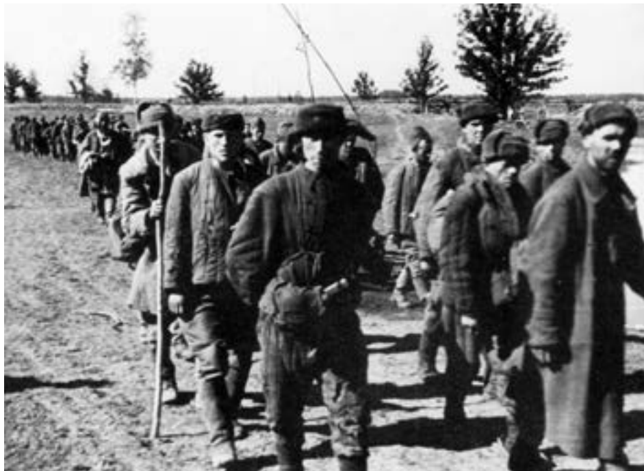
Колонна пленных из 2-й ударной армии