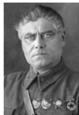
Ф. А. Пархоменко