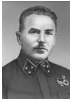
В. И. Кузнецов