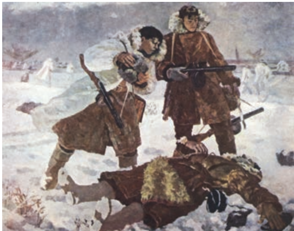
Картина В. Г. Одинцова «За Сталинград. Нашли товарища». 1945 г.