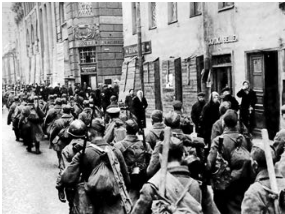
Части Красной армии направляются на передовую по ленинградским улицам