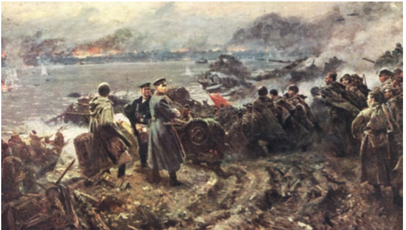
Картина В. К. Дмитриевского «Сталинградская переправа в 1942 году». 1950 г.