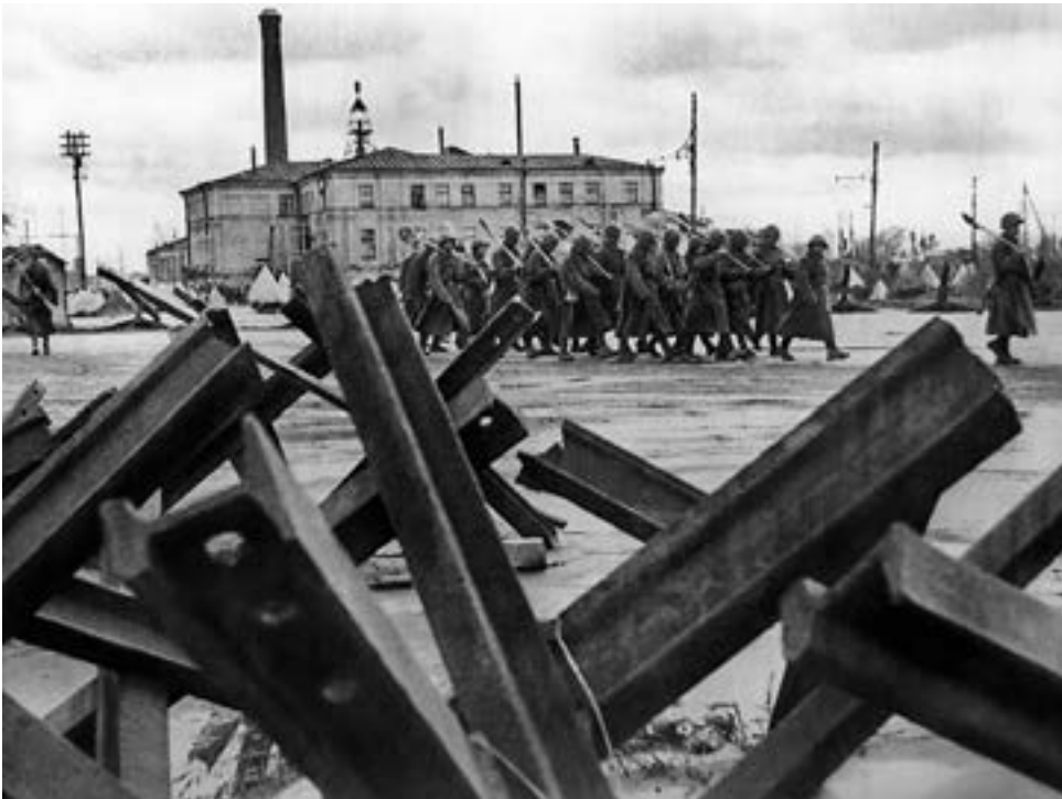
Бойцы инженерных частей в Ленинграде