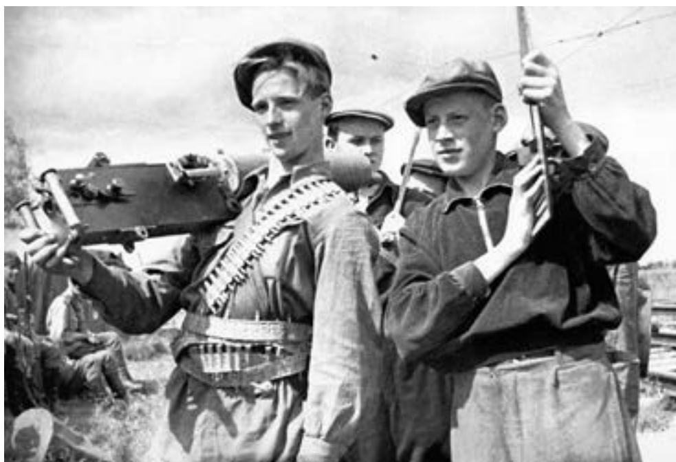
Молодые ленинградские рабочие во время учебных занятий