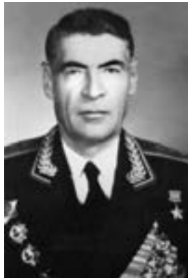
Г. И. Хетагуров