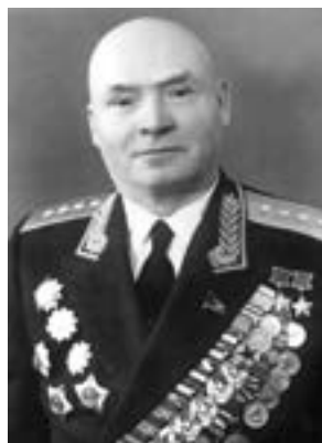
Д. Д. Лелюшенко