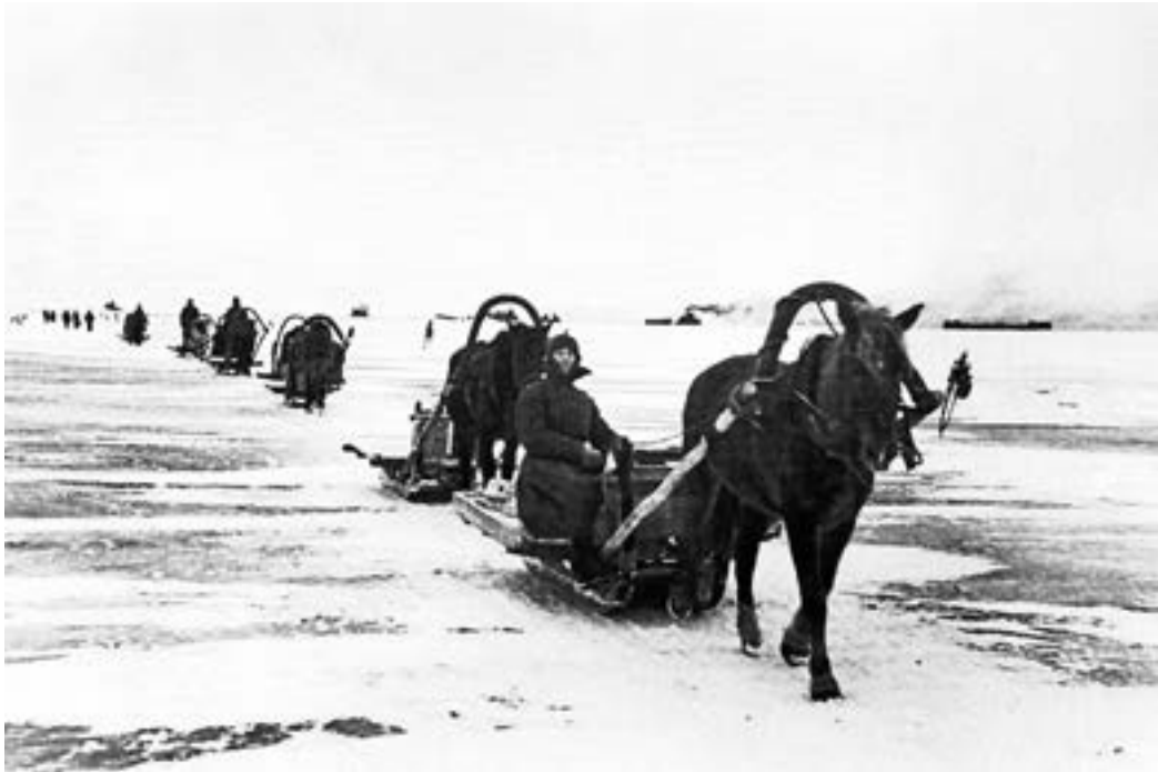
Порожний обоз направляется за продуктами для блокадного Ленинграда по льду Ладожского озера