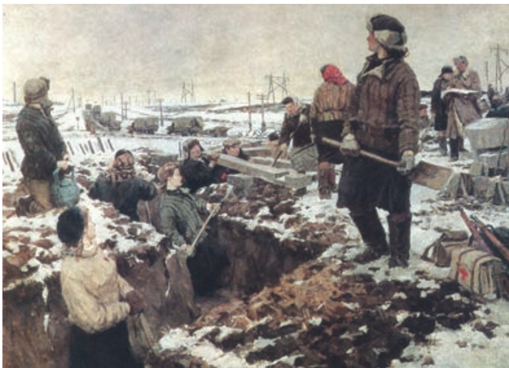
Картина И. И. Осенева «Комсомольцы на строительстве оборонительных рубежей под Москвой». 1948 г.