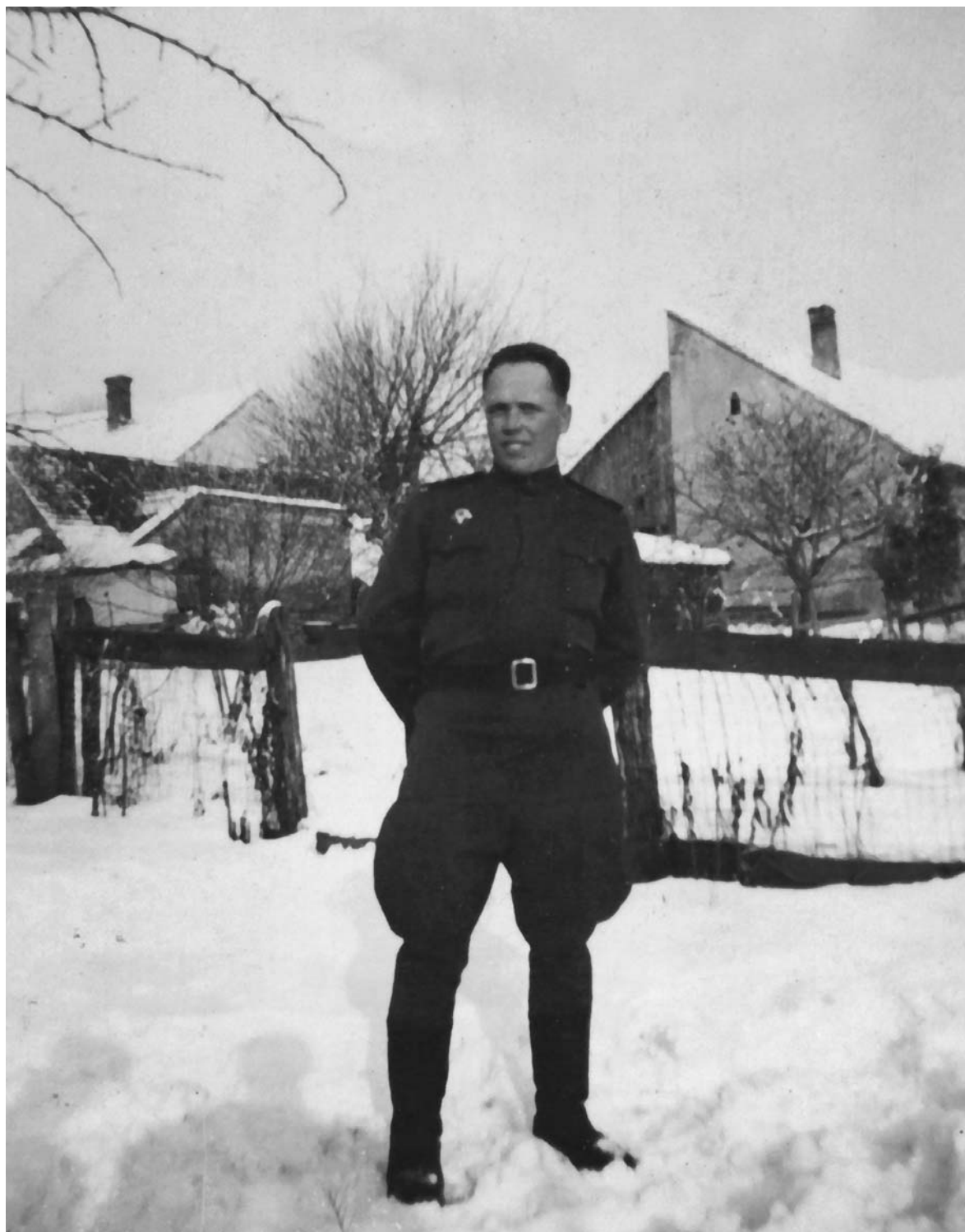
Командир взвода ГУКР Смерш 3-й танковой армии 3-го Украинского фронта