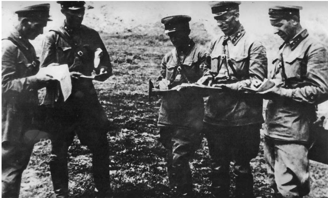
Комсостав 2-й роты 178-го стрелкового полка войск НКВД на Мамаевом кургане