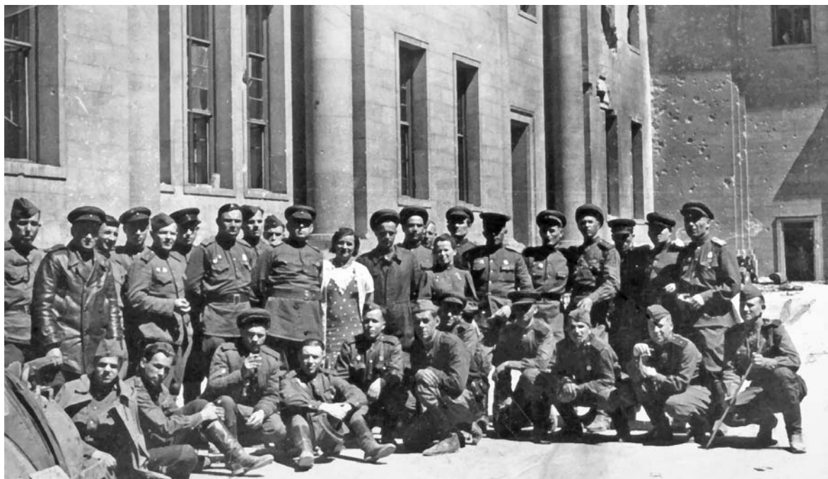
Групповой портрет личного состава отдела контрразведки Смерш 70-й армии у рейхсканцелярии в День Победы