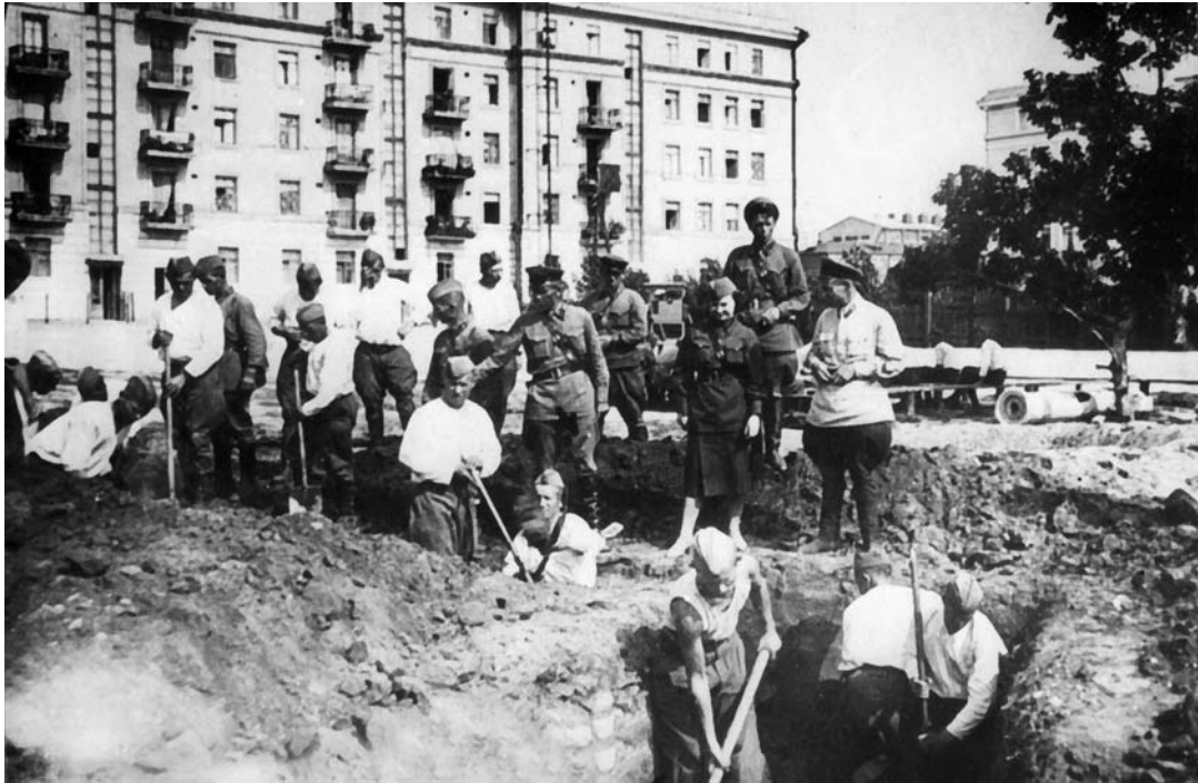
Бойцы 178-го стрелкового полка войск НКВД строят оборонительные сооружения в Сталинграде