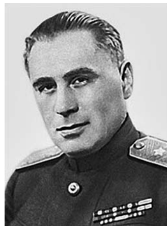
П. А. Судоплатов