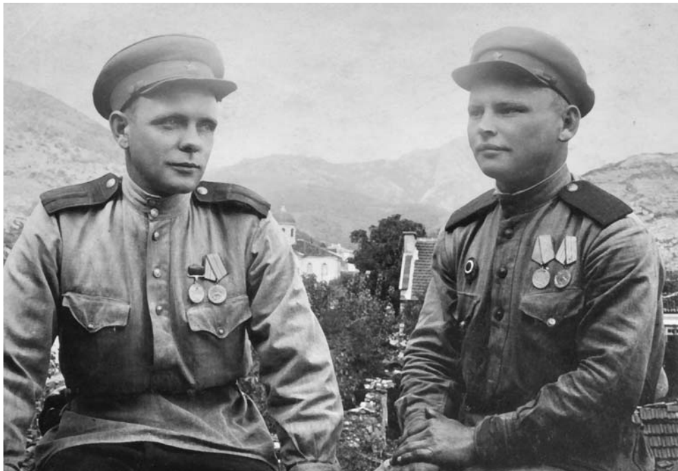
Старшина и рядовой отдела контрразведки Смерш 37-й армии в Болгарии