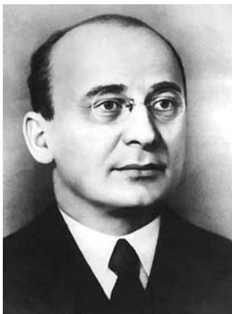
Л. П. Берия