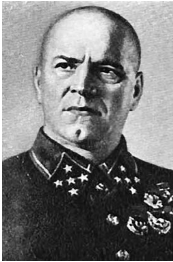
Г. К. Жуков