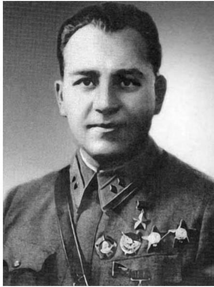
И. И. Проскуров

В июне 1939 г. начальником 5-го (разведывательного) управления РККА был назначен Герой Советского Союза комдив И. И. Проскуров, который по своему положению одновременно стал заместителем наркома обороны. В период Советско-финляндской войны 1939–1940 гг. И. И. Проскуров приложил немало сил, чтобы организовать добывание ценных сведений о противнике. Ему многое удалось сделать, однако добытая информация не в полной мере использовалась руководством Наркомата обороны, что отрицательно сказалось на ходе и результатах боевых действий.