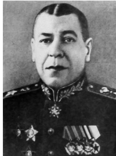
Б. М. Шапошников