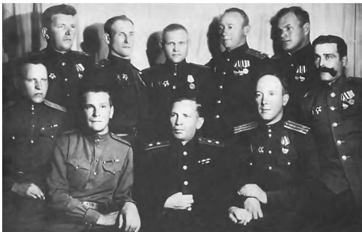
Группа офицеров Генштаба, работавшая с А. М. Василевским при его выездах на фронт