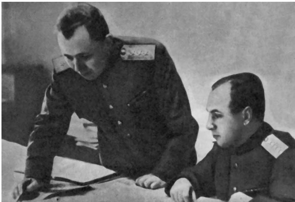
Первый заместитель начальника Генерального штаба А. И. Антонов (справа) и начальник Оперативного управления С. М. Штеменко

На Главное организационное управление Генштаба возлагались следующие задачи: подготовка предложений и директив по проведению различных организационных изменений в Красной армии; учет количества войск, их дислокации и потерь; разработка штатов, а также планов и директив по выводу соединений и частей в резерв Ставки и по межфронтным перегруппировкам; осуществление контроля над состоянием воинских формирований, находящихся в резерве Ставки, их доукомплектованием и обеспечением и прочее 34 .