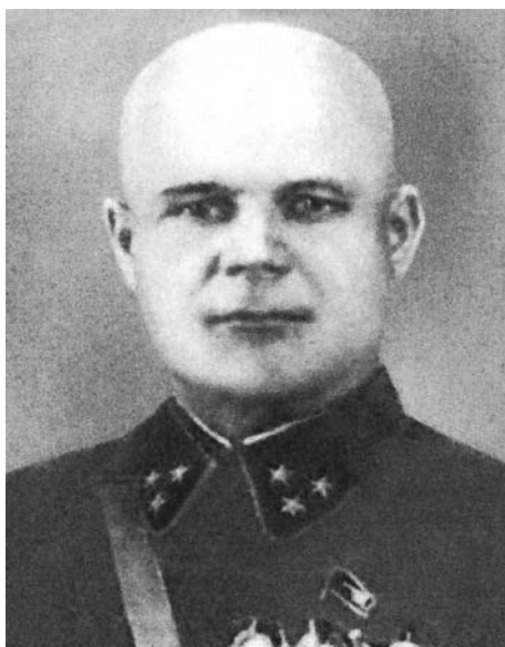
Ф. И. Голиков