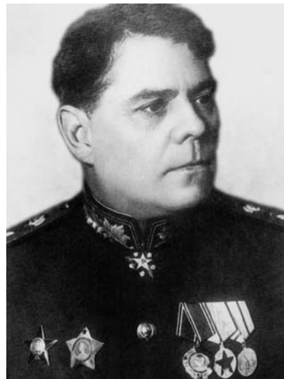
А. М. Василевский