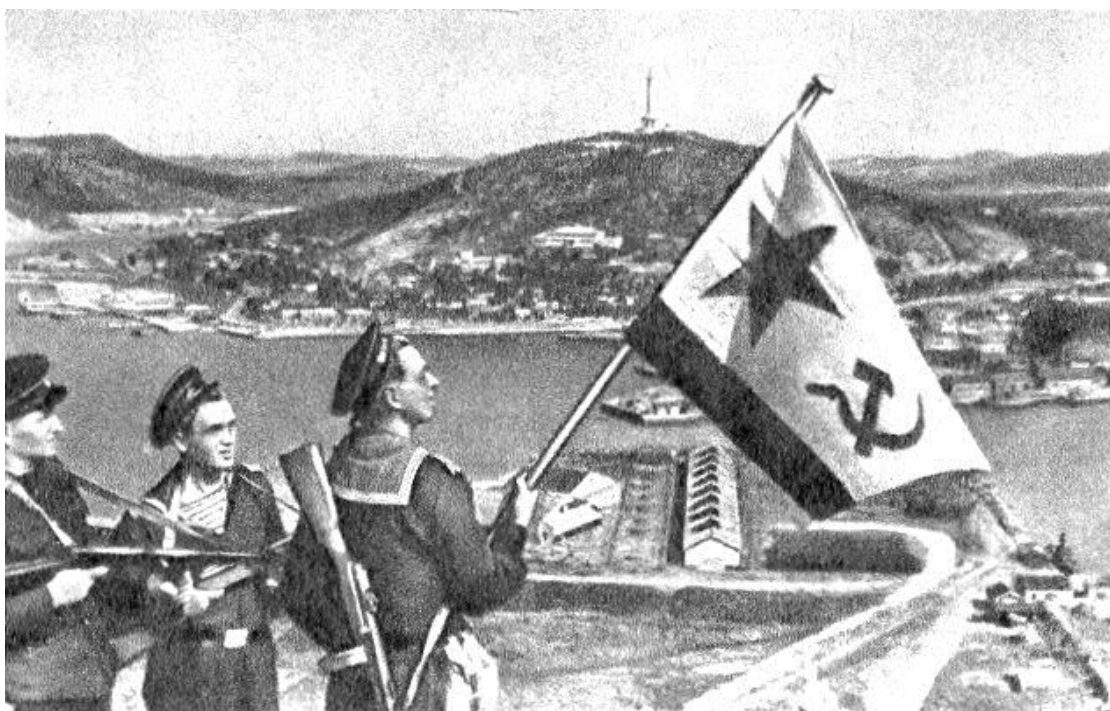
Флаг Военно-Морского флота СССР над Порт-Артуром