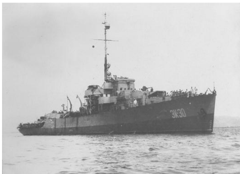
Полученный по ленд-лизу фрегат

Судоремонтники работали над повышением интенсивности производства. В дни войны большой размах получила творческая мысль и изобретательство рабочих и технической интеллигенции, что сыграло большую роль в росте и совершенствовании производства. Только на одном Дальзаводе за четыре года было внедрено более 5 тыс. рационализаторских предложений, позволивших сэкономить около 12 млн руб.