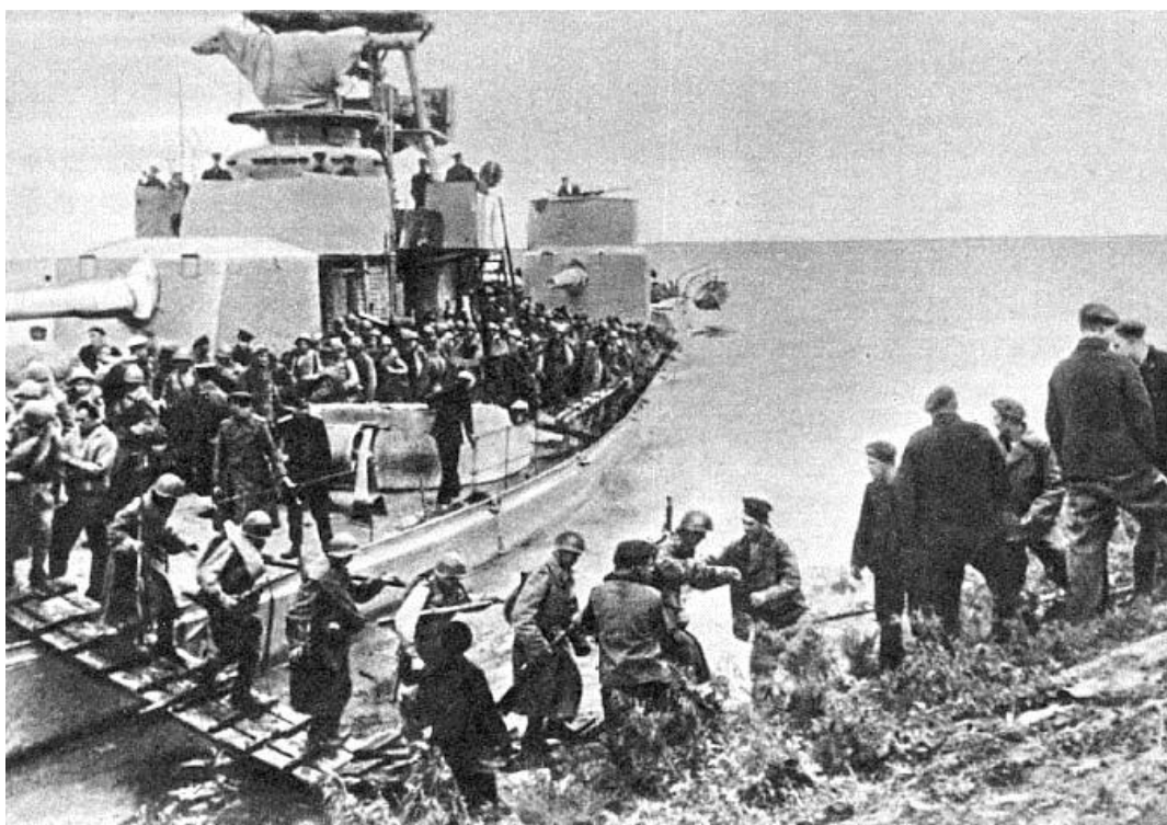
Высадка десанта с монитора «Свердлов». В числе его комендоров были и курсанты ТОВВМУ

В этих боях, а также в десантах Краснознамённой Амурской флотилии участвовали курсанты ТОВВМУ. Они обслуживали башни мониторов флотилии – самых мощных речных кораблей мира, своим огнём поддерживавших высадку десантов и обеспечивавших высокие темпы продвижения советских войск к Харбину. За отличие 31 курсант был награждён боевыми наградами – орденами и медалями. Не всем из них удалось вернуться живыми. Так, на подводной лодке Л-19, исчезнувшей у берегов Сахалина, погибли 5 курсантов училища, в десанте в Сейсин погибли два курсанта, обучавшиеся на 13-месячных курсах командиров катеров и находившиеся на флотской стажировке.