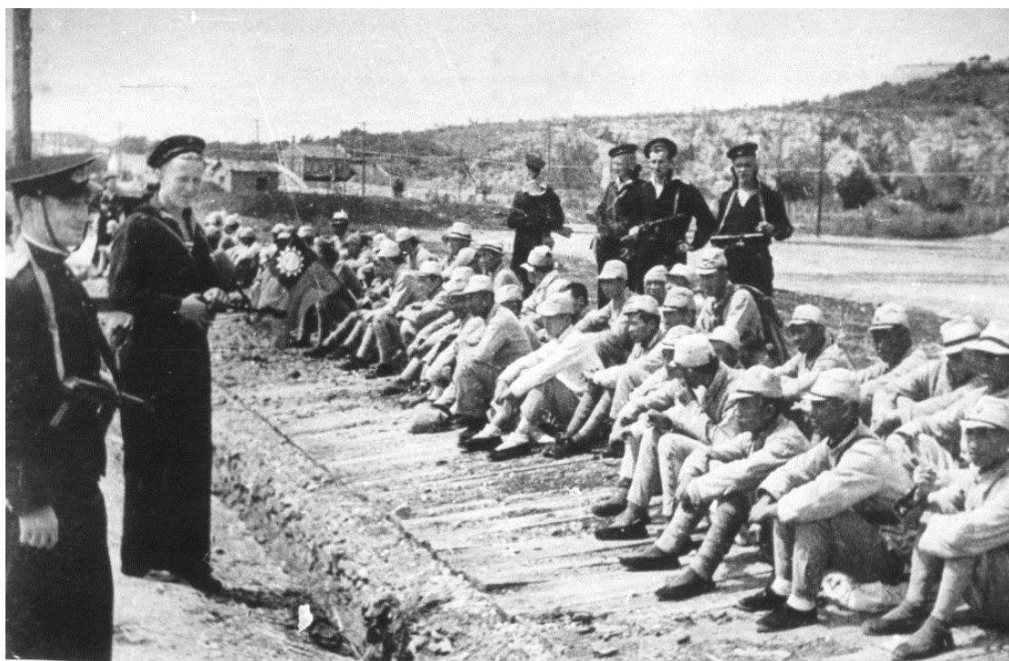
Наши моряки вместе с китайскими солдатами в освобождённом Порт-Артуре

1904–1905 гг. Они также оказали помощь китайскому народу в освобождении своей страны от японских оккупантов.